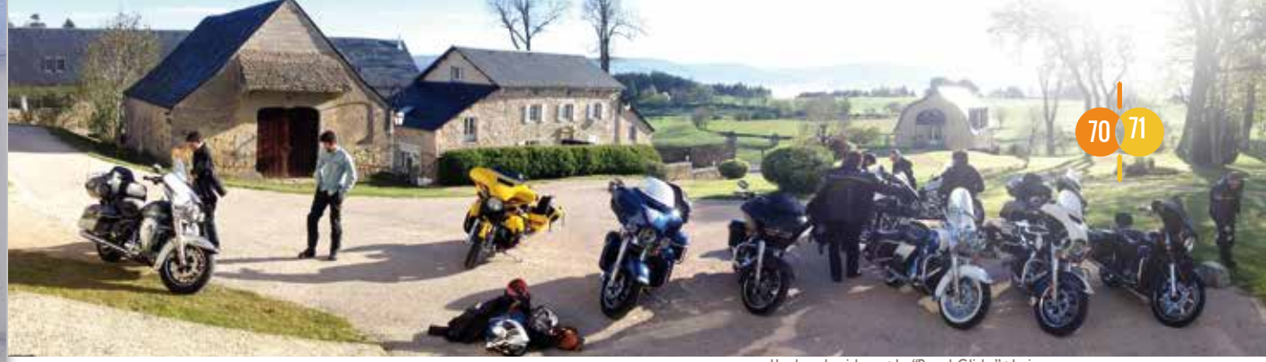
Harley davidson : la "Road Glide" : la jaune