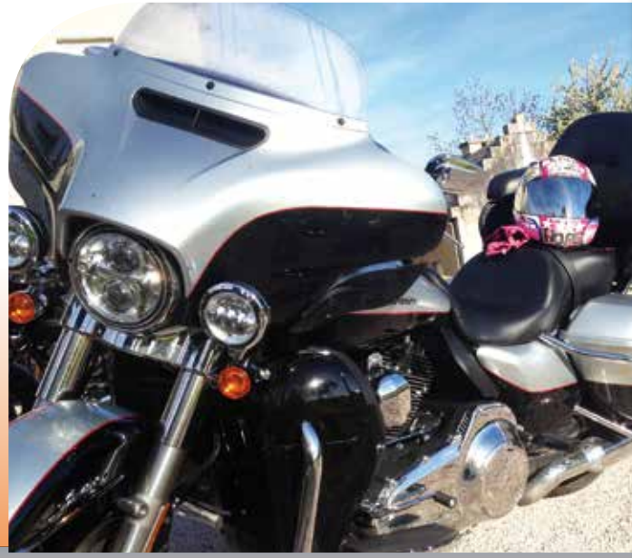
L'Ultra Low Limited